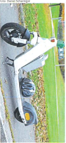
Junge Lenker und getunte E-Scooter – eine gefährliche Kombi

Was auch notwendig ist. Denn immer häufiger verwandeln junge Burschen und Mädchen Gelwege oder Spielplätze mit diesen pfeilschnellen Gefährten zu