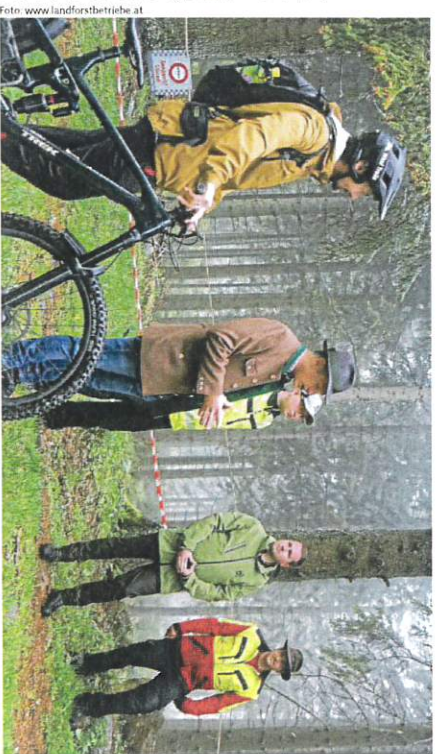
Gemeinsam über das Thema „Natur“ reden: Es geht nicht um Verbote, sondern Verantwortung.

Die Botschaft der Kampagne ist daher klar: Es geht nicht um Verbote, sondern um Verantwortung. Wer auf ausgewiesenen Strecken bleibt, sich vorab informiert und mit Naturerstand unterwegs ist, kann den Wald unbeschwert genießen – und trägt damit dazu bei, dass dieses besondere Naturerlebnis auch für kommende Generationen erhalten bleibt. M. Perry, L. Lusatzky